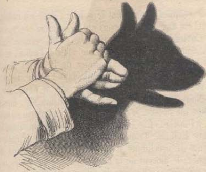
Le Chien roquet.