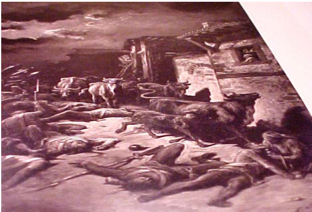
Gustave Dorè ... il pittore si noti la spettacolare percezione tridimensionale che le due tele riescono a dare